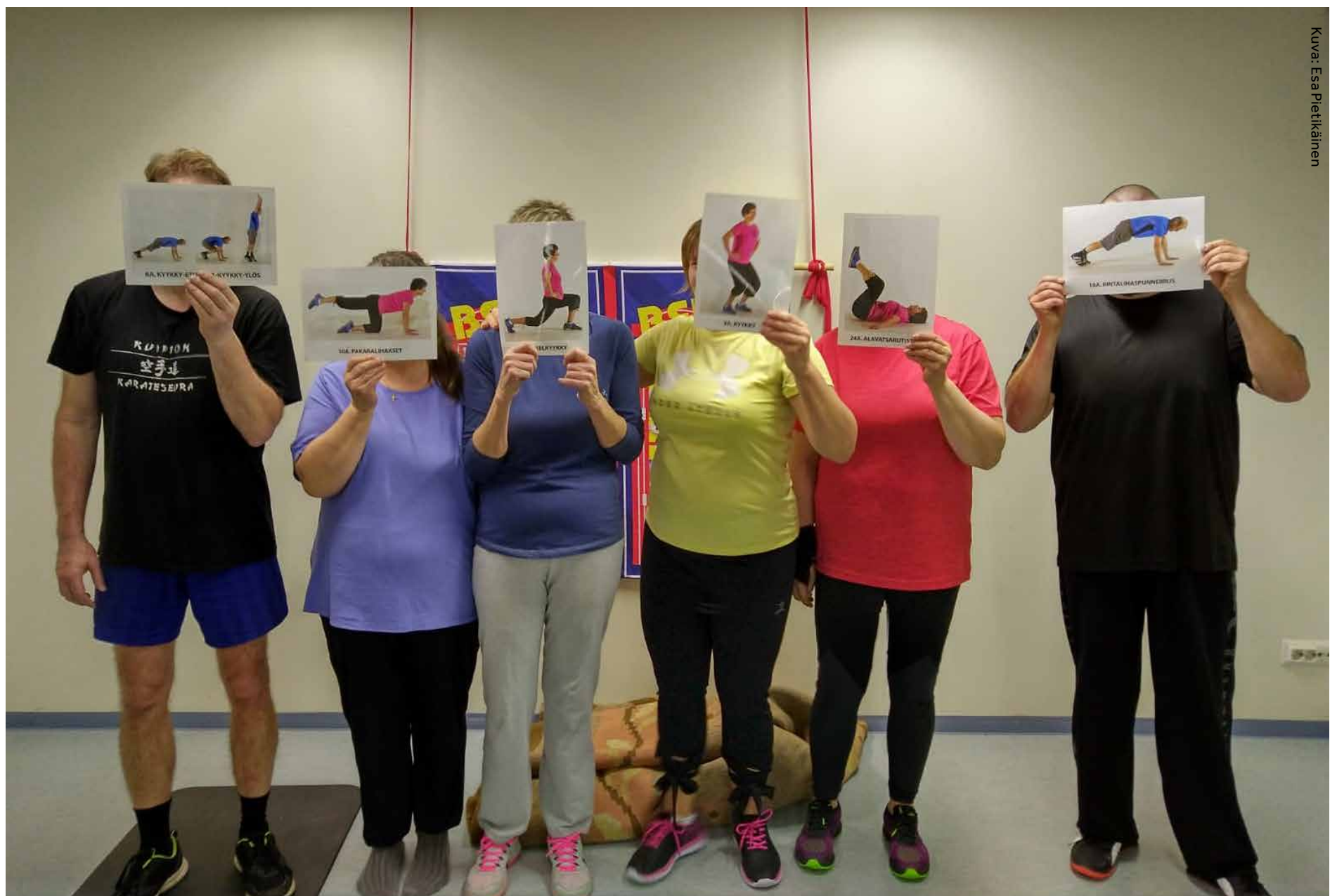
Taivaanpankontien jumppaporukka opastaa kuvien avulla.