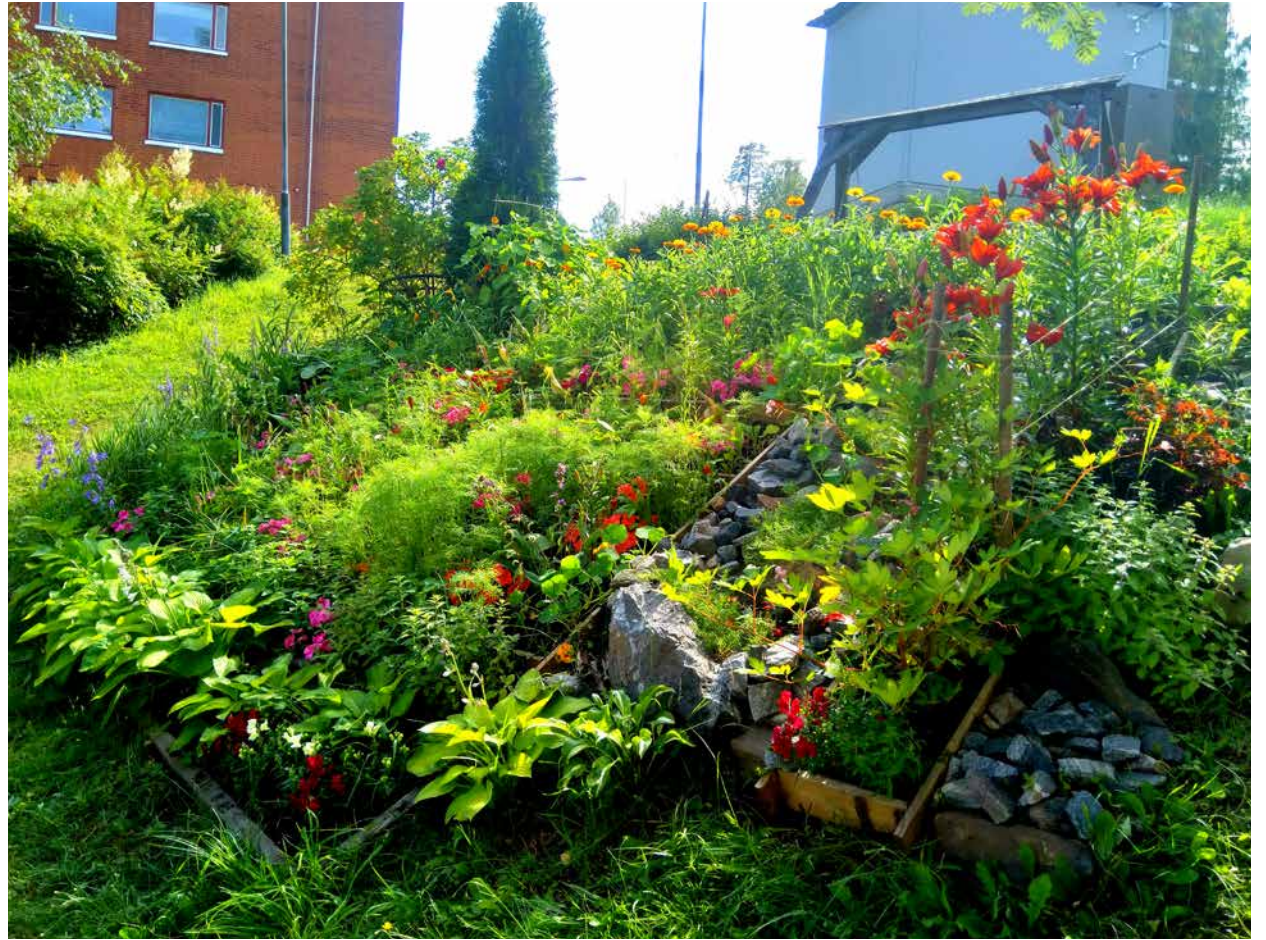
Annikintie 3:n kukkaistutuksia.