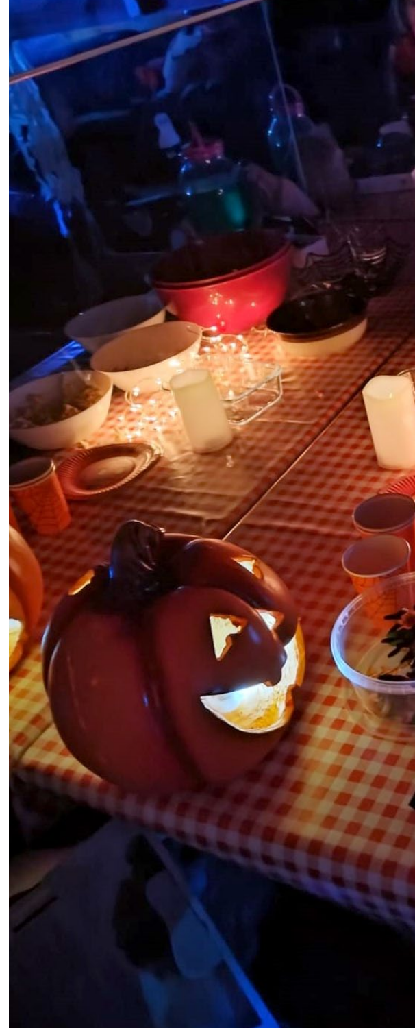
Halloweenina oli hämärä tarjoilu. Diskotunnelmaa täydensivät näyttävät valot.