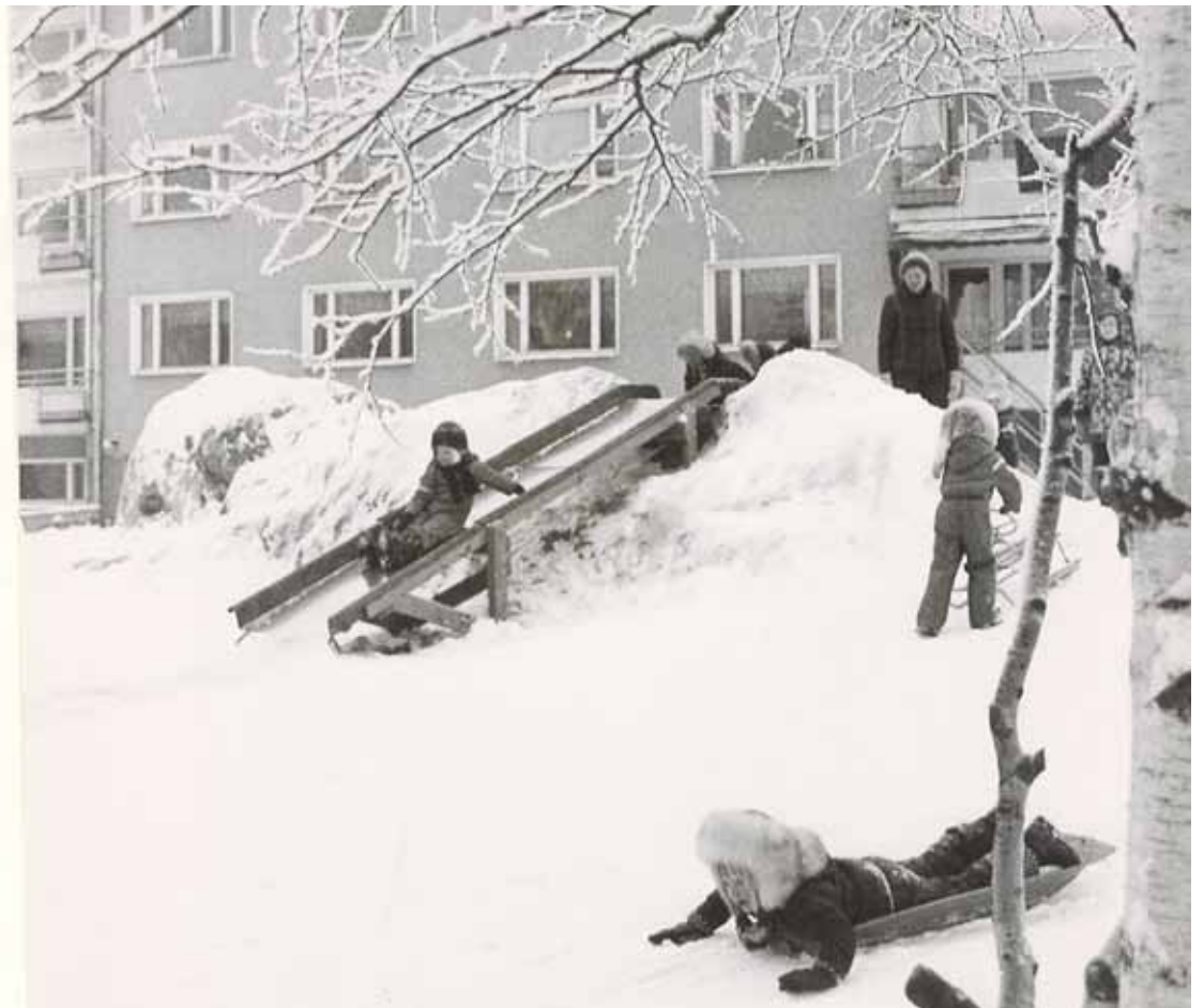
Lapset talvileikeissä Kiinteistö Oy KYKS henkilökunnan asuntojen talon pihalla 70-luvulla.

Vuoden 2016 alusta alkaen Niiralan Kulman siihen astinen tytäryhtiö Kiinteistö Oy Kuopion Ellankulma sulautettiin Ni-