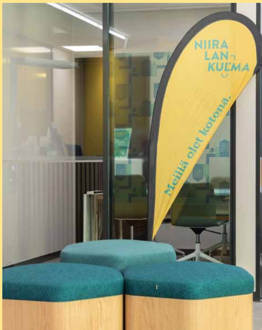
Nikulla on uudet, viihtyisät toimitilat hyvien kulkuyhteyksien päässä (=junaradan varrella 😊) Hatsalankadulla.

Voit seurata Niiralan Kulmaa myös sosiaalisessa mediassa: Facebookissa, Instagramissa ja YouTubessa. Yli 70-vuotias yhtiö esittelee ja esittäytyy monin tavoin! Esimerkiksi Facebookissa alkoi juuri Nikulaisen matkassa -sarja, jossa esitellään yhtiön moninaisia työtehtäviä ja työntekijöitä. Sarjaa voit seurata myös verkkosivujen KULMAssa.