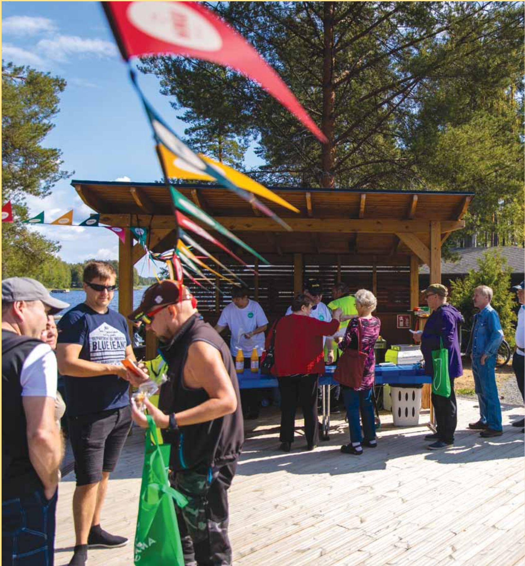
Nikun asukasneuvoston jäsenet ja muut aktiivit ahkeroinvat esimerkiksi yhteisten tapahtumien suunnittelussa ja järjestelyissä. Kuva Nikun asukkaille järjestetystä yhtiön 70-vuotistapahtumasta Rauhalahdessa 10.8.2019.