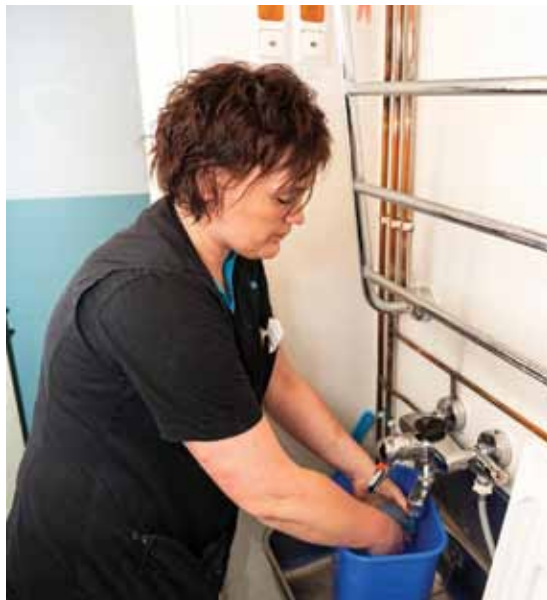
Kiinteistösiivoojien mopit ja siivousliinat käyvät tiuhaan tahtiin, kun he liikkuvat talossa. Ovenkahvat, kaiteet ja hissien ja valokatkaisijoiden nappulat puhdistuvat oikeastaan aina, kun siivoustyön