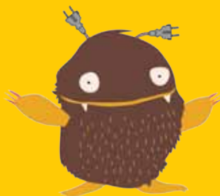
HiiWatti neuvoo asukkaita energia-asioissa.

Linkit webinaareihin tulevat myöhemmin kampanjan kotisivuille https://www.kuopio.fi/taloyhtiokampanja