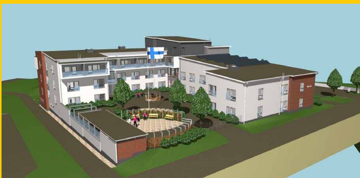
Havainnekuva Liito-oravan hoivakodista, joka valmistuu tulevana syksynä.

Hoitokoti Liito-orava on uudenlainen hybridimallin talo, jossa samassa kiinteistössä on tehostettua palveluasumista ja ikäihmisille suunnattua vuokra-asumista. Yhteensä kiinteistöön valmistuu 72 asuntoa, joista 56 on tehostettua palveluasumista varten ja 16 tavallisia vuokra-asuntoja. Talo valmistuu osoitteeseen Palomiehenkatu 2 lokakuussa 2021.