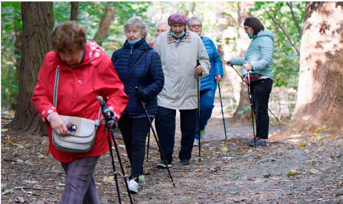
Liikunta- ja kulttuuritoimintaa ikäihmisille on tarjolla runsaasti.