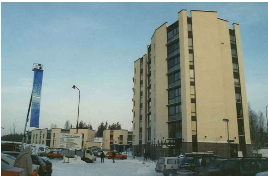
Hauenkoukku 3:ssa järjestettiin Avoimet ovet kiinteistön valmistumisvaiheessa vuonna 2004.