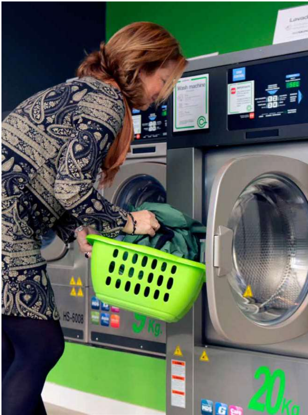
Ikäihmisten on usein vaikea löytää pesula-, siivous-, asiointi- yms. palveluita.