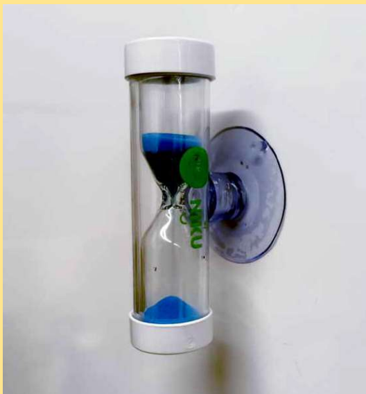
Hyvä suihkuttelu-aika on noin 2 minuuttia, jolloin vettä kuluu noin 24 litraa.

Tuoreimmassa mittauksessa (Motiva, 2020) suomalaisten keskimääräinen vedenkulutus oli noin 113 litraa henkilöä kohden vuorokaudessa. Kuopiolaiset käyttivät vettä 153 litran keskiarvolla. Koronapandemia nostaa lukua tällä hetkellä todennäköisesti jonkin verran. Niiralan Kulman asunnoissa vettä kuluu eniten peseytymiseen, noin 45 prosenttia kaikesta käytetystä vedestä. Suurin kulutuskohte on suihku ja siinä käytettävä lämmin vesi.